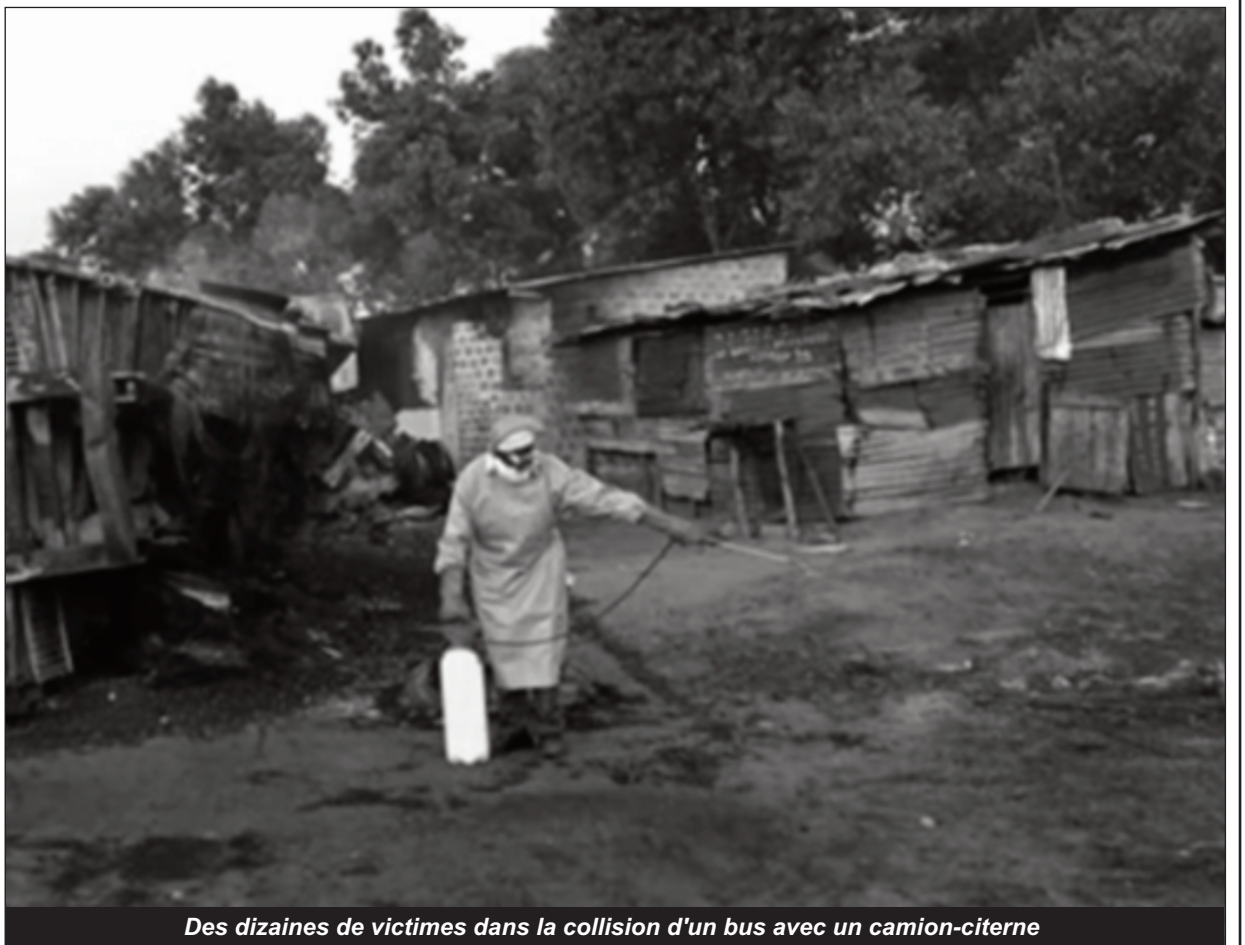
Des dizaines de victimes dans la collision d'un bus avec un camion-citerne

Selon le gouverneur de la province du Congo-Central et le ministre de la Santé, on dénombre une vingtaine de morts et une centaine de bles-