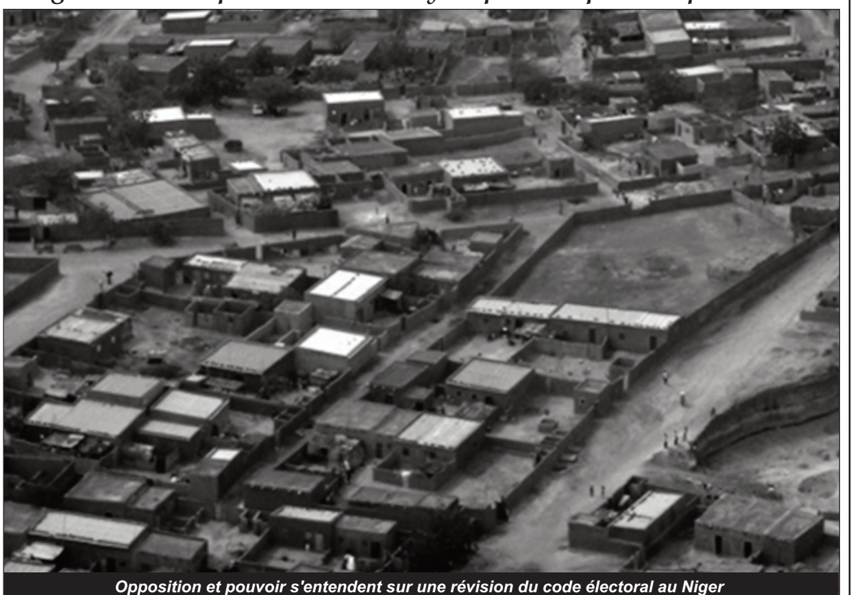
Opposition et pouvoir s'entendent sur une révision du code électoral au Niger