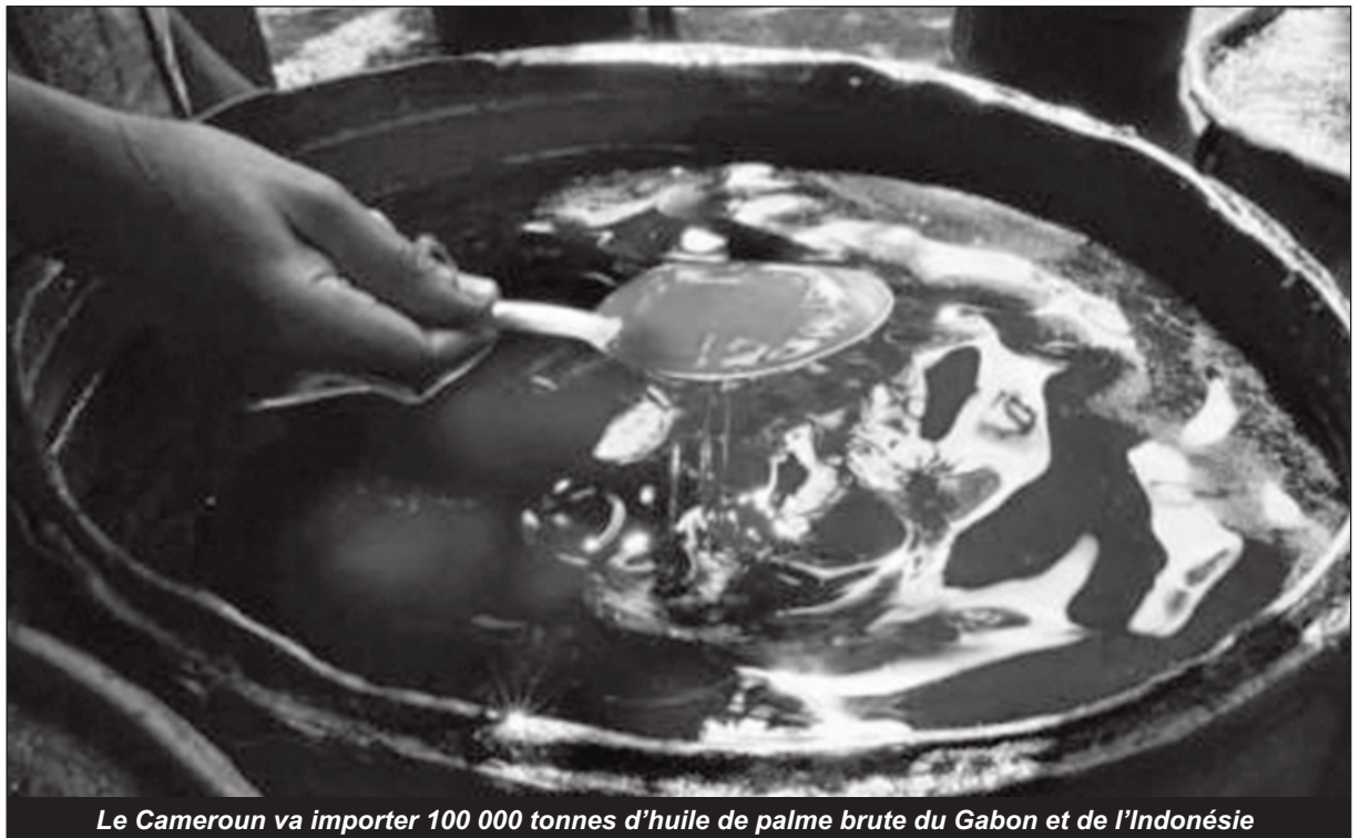
Le Cameroun va importer 100 000 tonnes d'huile de palme brute du Gabon et de l'Indonésie